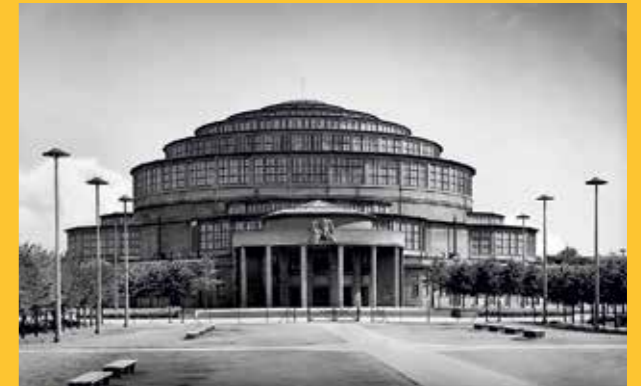
Breslau, Jahrhunderthalle, 1926