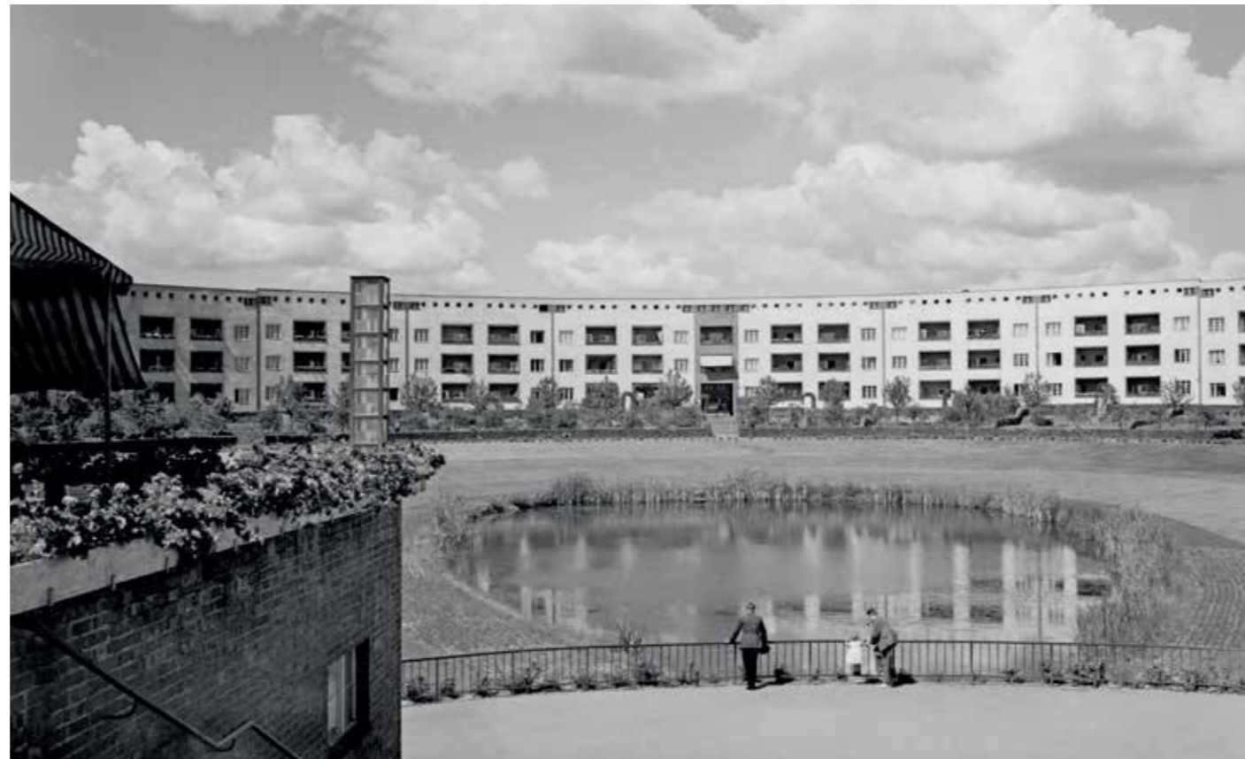
Berlin-Britz, Hufeisensiedlung, 1932

Titelbild: Berlin-Charlottenburg, Bahnhofsterrasse am Bahnhof Zoologischer Garten, 1960